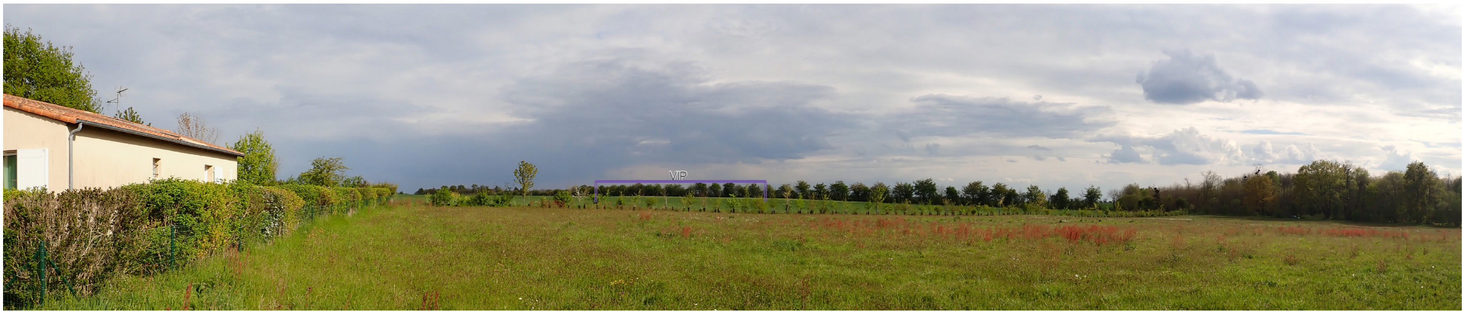
Photo 42 : Depuis la frange est de Romagne, le VIP est tronqué par la végétation