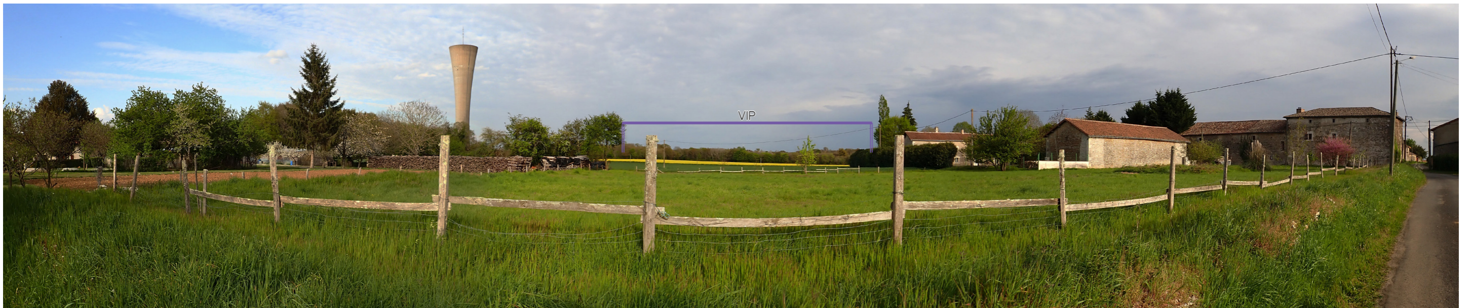
Photo 41 : Depuis Féolle, le VIP est visible à l'horizon depuis une ouverture dans la trame bâtie du bourg