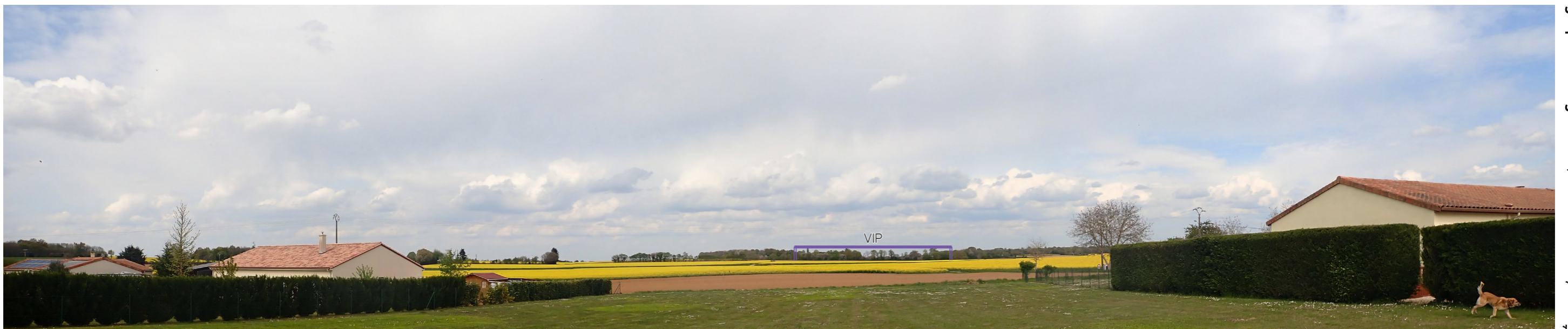
Photo 44 : Depuis la frange nord de Saint-Gaudent le VIP est perceptible mais filtré par la végétation et avec une hauteur apparente faible