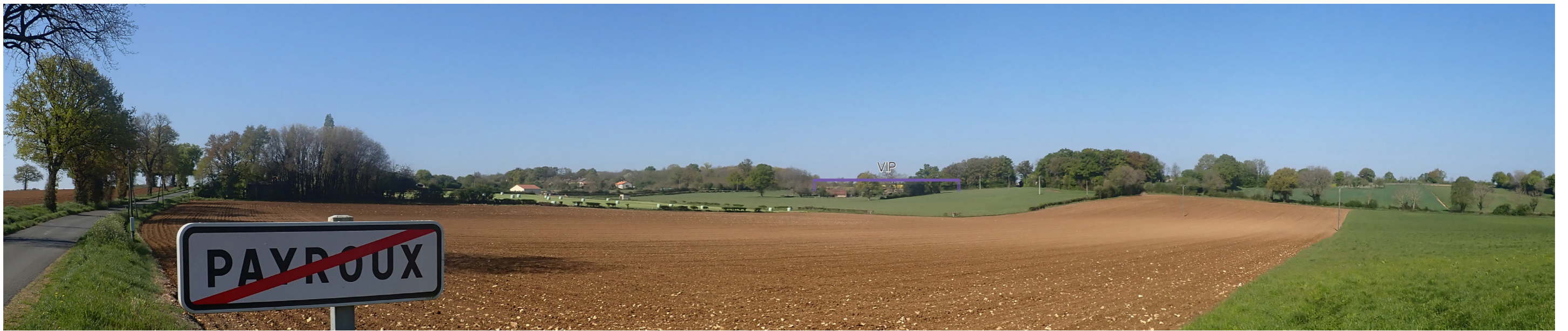
Photo 36 : Depuis la frange sud de Payroux, sur la RD 100, le VIP est tronqué par l'élévation du relief, il est totalement masqué par la végétation depuis les habitations à proximité