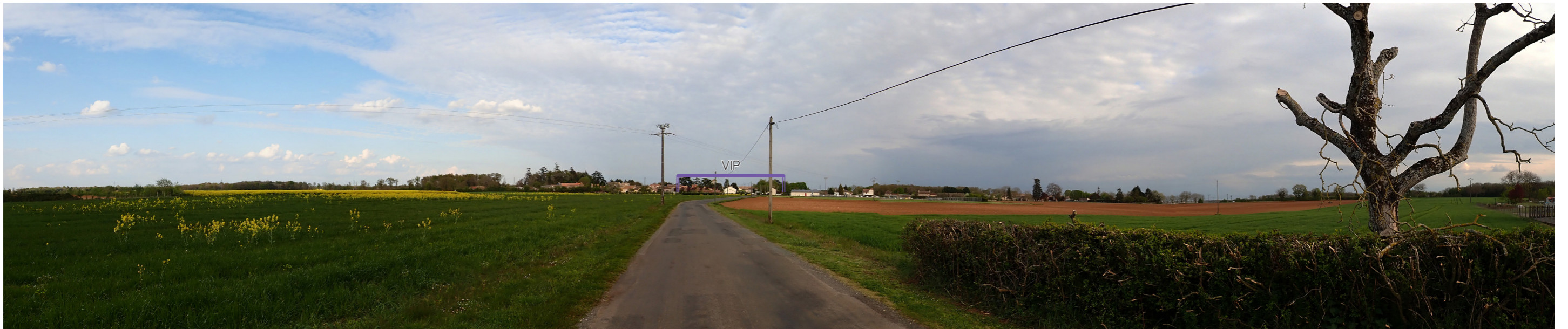
Photo 40 : Depuis l'axe reliant la RD 7 à Blanzay, il y a un risque de covisibilité directe entre le VIP et le bourg de Blanzay ; toutefois, la prégnance du VIP est fortement limitée par la trame végétale du bourg