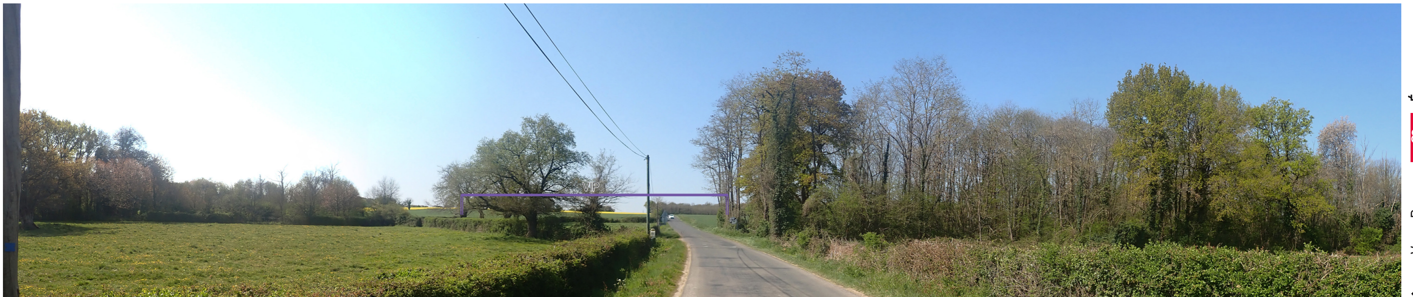
Photo 43 : Depuis la RD 36, à la sortie de la Chaume, le VIP est en partie tronqué et filtré par la végétation