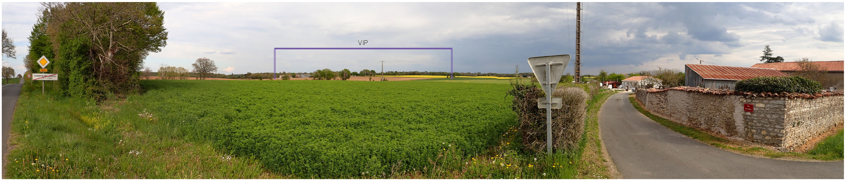
Photo 39 : Depuis la RD 1, sur la frange nord de Champagné Lureau, les vues sont ouvertes et dégagées, le VIP est prégnant et apparait au dessus de la silhouette de bourg de la Groie