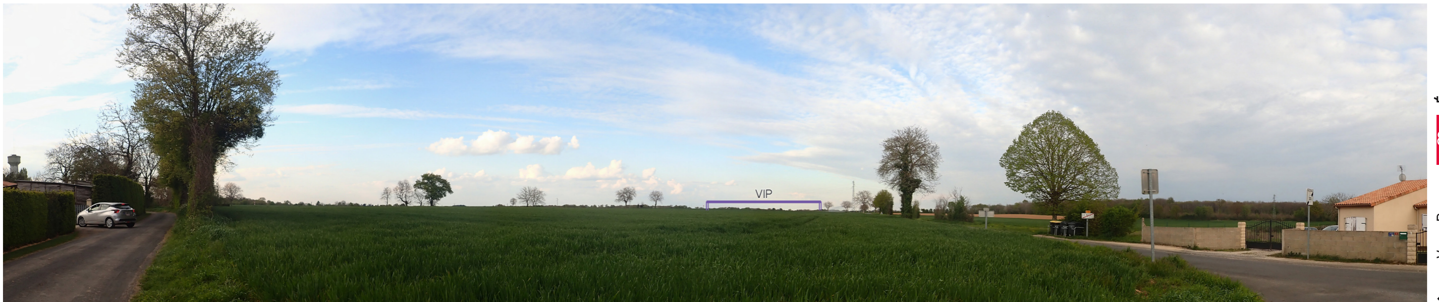
Photo 37 : Depuis la D 103, à la sortie de Breuil d'Haleine les vues sont ouvertes, le VIP est visible en intégralité à l'horizon mais sa prégnance est faible