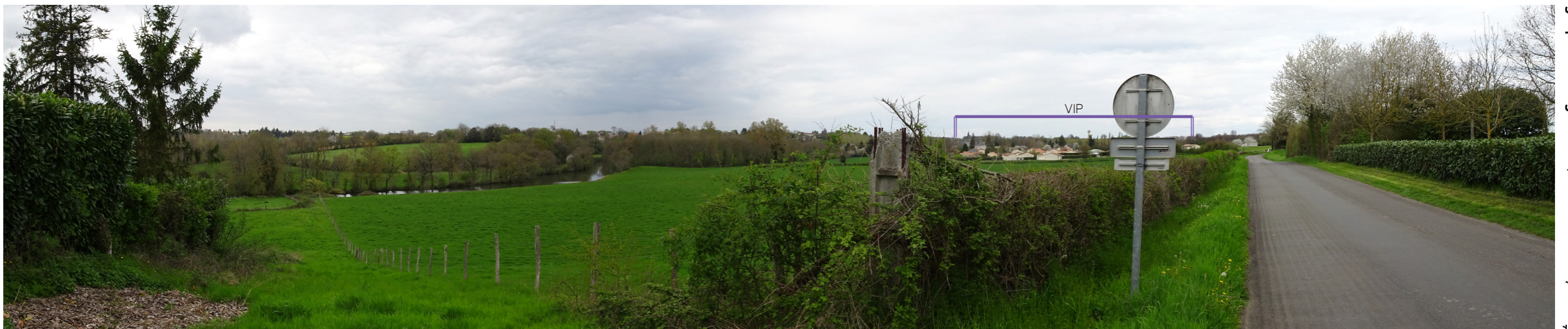
Photo 38 : Depuis la sortie de Civray, le VIP est visible et prégnant au dessus de la silhouette de bourg de Savigné